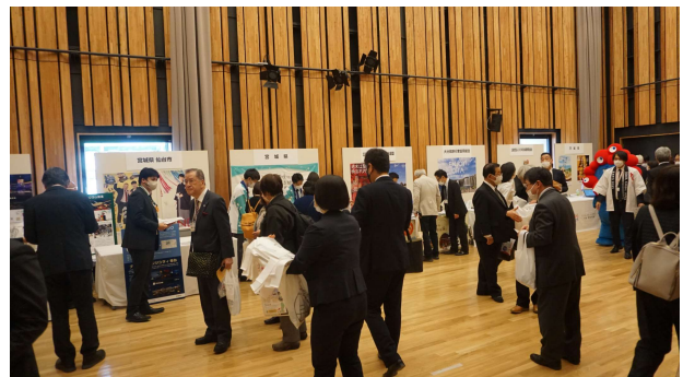
第17回 やまがた開催 ブース会場