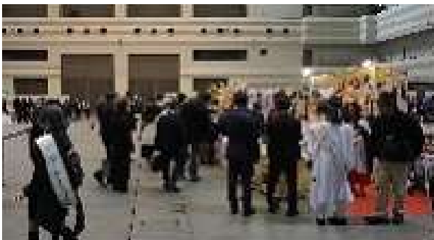
第18回 あいち開催 ブース会場