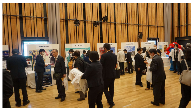
第17回 やまがた開催 ブース会場