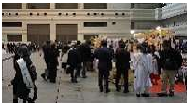
第18回 あいち開催 ブース会場